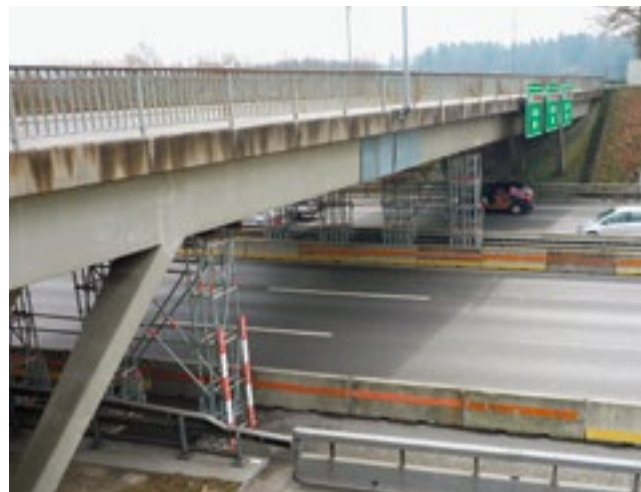
Die Sicherung besteht aus Gerüsten mit Anprallschutz auf den Mittel- und Pannenstreifen sowie Abdeckblechen beim Schaden.