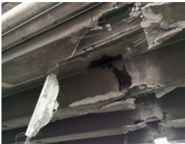
Der Ausleger zerschneidet die Hohlkastenträger. Die Hüllrohre mit den Vorspannkabeln wurden freigelegt, aber nicht verletzt.