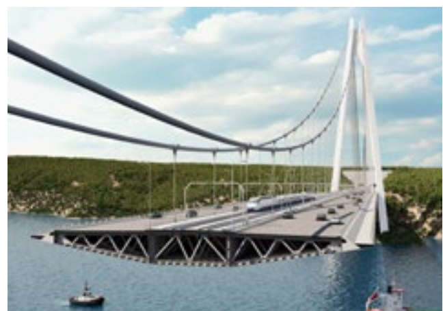
Die 58.5 m breite Fahrbahn trägt zwei Bahnspuren, acht Autobahnstreifen und zwei Fussgängerstreifen.